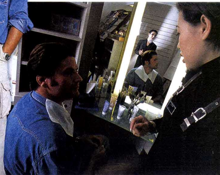
LA MAQUILLEUSE-ESTHÉTICIENNE donne aussi ses conseils. Essais de soins revitalisants, crèmes de jour ou de nuit, le néophyte découvre un univers jusque-là inconnu.