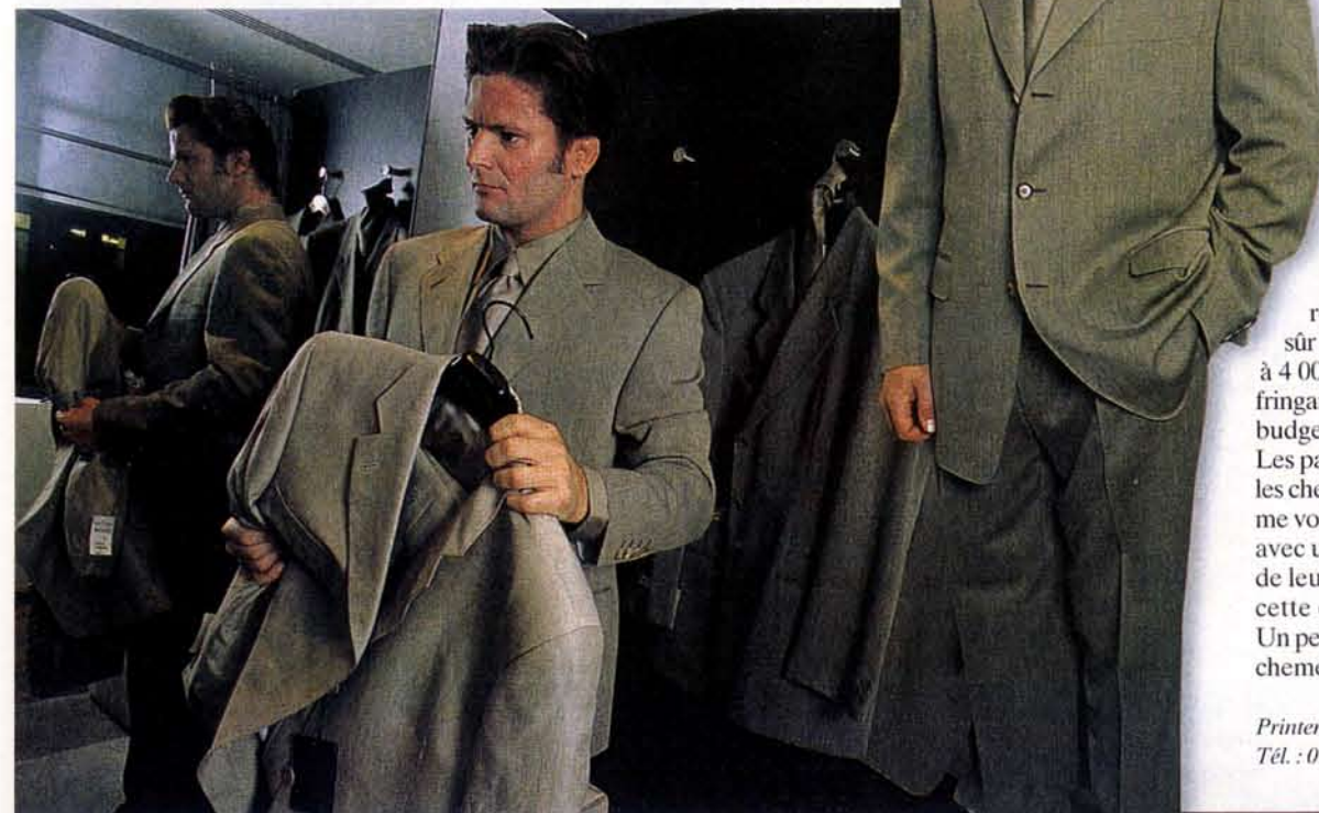
ÉTAPE FINALE Une fois la coupe, les matières et les couleurs des vêtements choisies en fonction de l'étude, rendez-vous dans un salon pour l'essayage.

jour, j'ai découvert qu'il y avait vingt-cinq types de tempéraments masculins et féminins : cristal, granit, botticellien... » Et Josy se penche sur mon cas. En dix minutes chrono, elle dresse une analyse psychologique troublante. Mon enfance, les différents domaines où j'aurais pu exceller n'ont pas de secret pour elle. Simple coup de chance ou incroyable sagacité ? Puis elle passe aux matières et aux couleurs qui me collent le mieux à la peau : vêtements amples, des costumes en lin, des velours côtelés, des couleurs caramel ou des verts plutôt clairs. Là, faudra voir. Le style Philippe Noiret retour de bocage normand après un week-end pluvieux, très peu pour moi. Pour le client qui n'aurait pas tout assimilé, une styliste esquisse différents dessins.