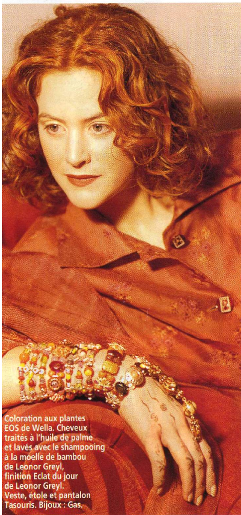
Coloration aux plantes EOS de Wella. Cheveux traités à l'huile de palme et lavés avec le shampooing à la moëlle de bambou de Leonor Greyl, finition Eclat du jour de Leonor Greyl. Veste, étole et pantalon Tasouris. Bijoux : Gas.

■ Betty Poudre, maquilleuse, pour M. YXT : 11, rue Jussienne, Paris II e . ■ Lean Tsi Ta, maquilleuse. ■ Fred Goudon, photographe.