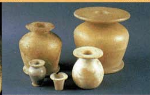
Porteuse d'auge - DAE, musée du Louvre © C2RMF, D. Vigears Pot à kohol - DAE, musée du Louvre © C2RMF, D. Vigears